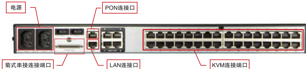
· KM0532 后视图